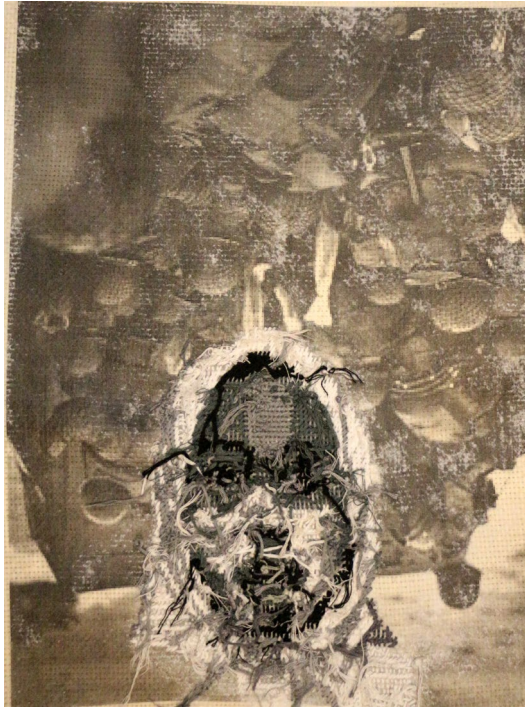
مونا جولا بدون عنوان چاپ و دوخت