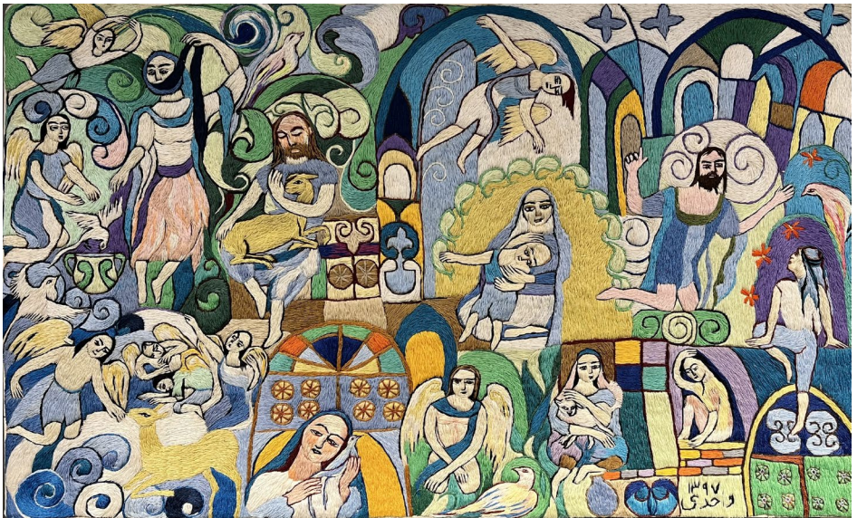
مجتبی واحدی تولد نور سوزن دوزی