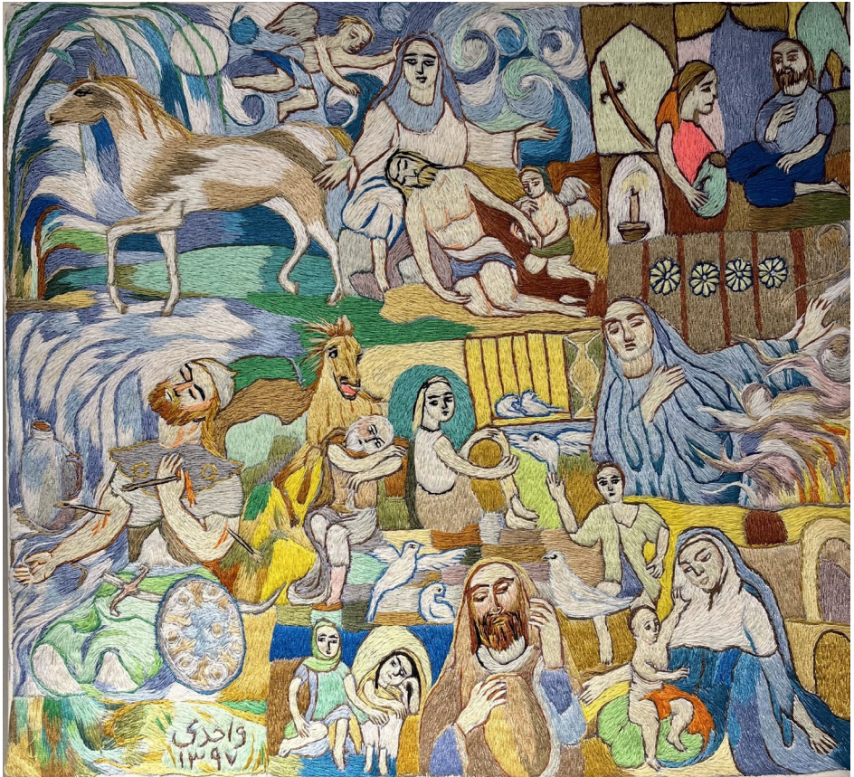
مجتبی واحدی عاشورا سوزن دوزی