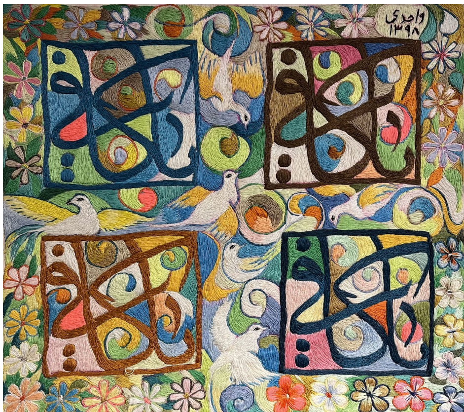
مجتبی واحدی یا کافی سوزن دوزی